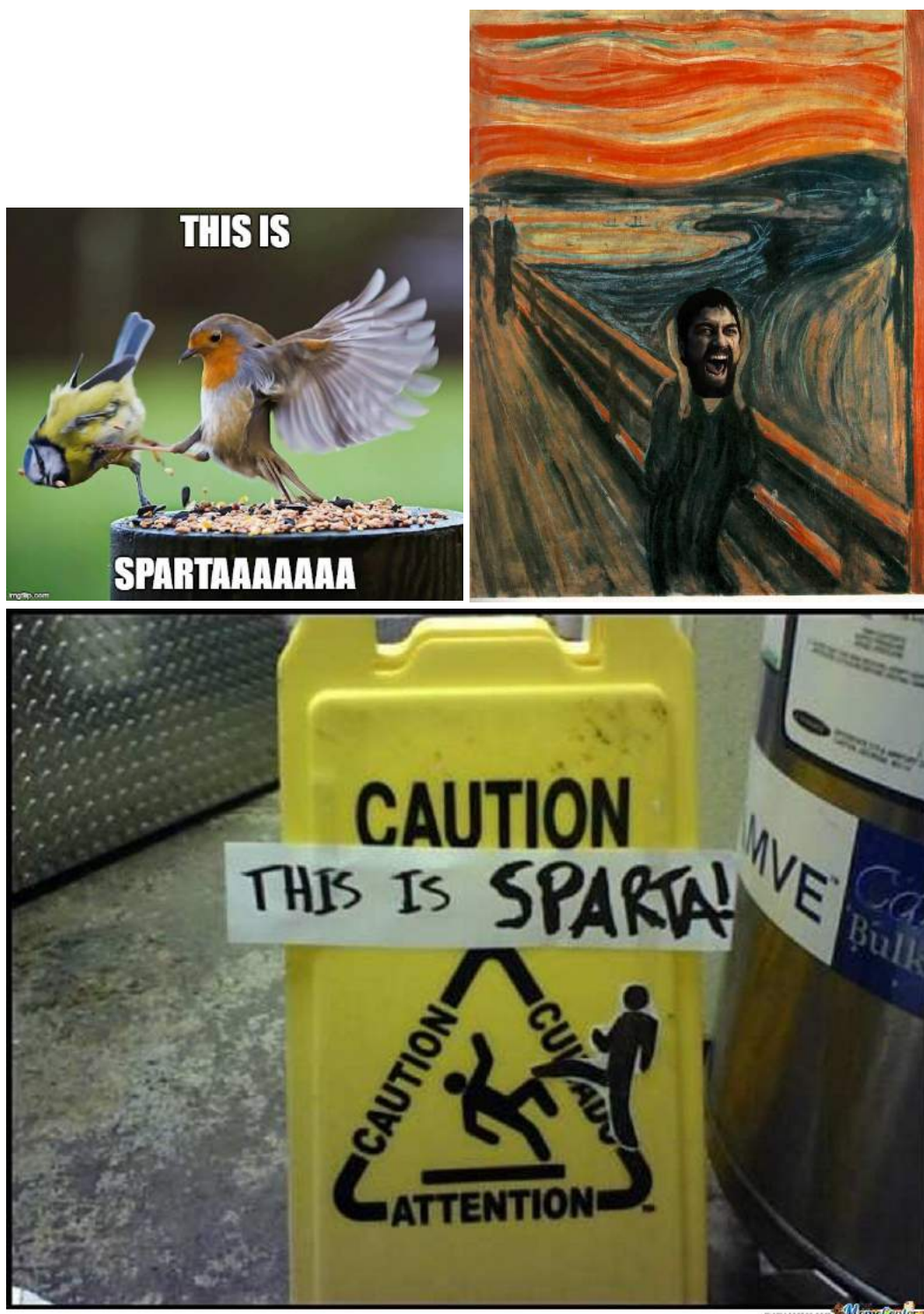
Fig. 5: Alcune delle infinite variazioni del meme This is Sparta!

In secondo luogo, il classico è per sua definizione mobile e viene sempre riscritto; nel momento in cui cessa di esserlo cessa anche di essere classico; al massimo,