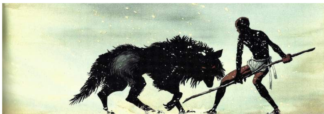
Fig. 2: La scena del lupo nel film vs. la scena del fumetto

reality of the event that it represents, and digital technology actually facilitates this subsequent simulation». (DIMITRIADIS 2002, 198).