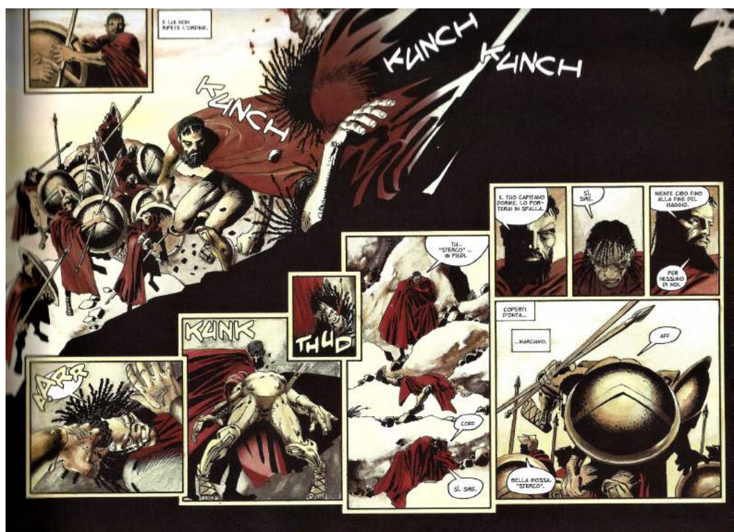
Fig. 1: Aspetti cinematografici nel fumetto di Miller

L'arte in generale è raramente tale se non si presta alla polisemia, o se non è fruibile a più livelli di significato; in effetti, in Italia ci sono, paradossalmente rispetto al resto del mondo 4 , più persone che conoscono il racconto di Erodoto che persone che abbiano letto il fumetto di Miller; perciò, in generale il pubblico italiano del film è un pubblico particolare, che si può dividere in quattro categorie: