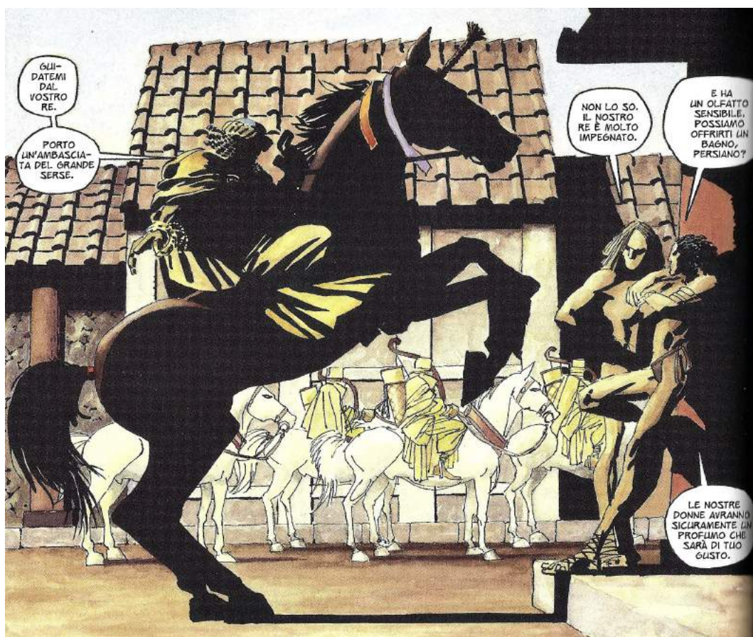
Fig. 3: Il cavallo rampante nel film vs. il fumetto